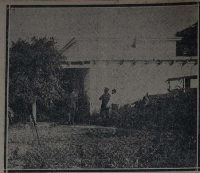
VISTA DE LA MODESTA CASITA DE CAMPO, EN LOS CARDALES, EN QUE FALLECIO EL DOCTOR JUAN B. JUSTO