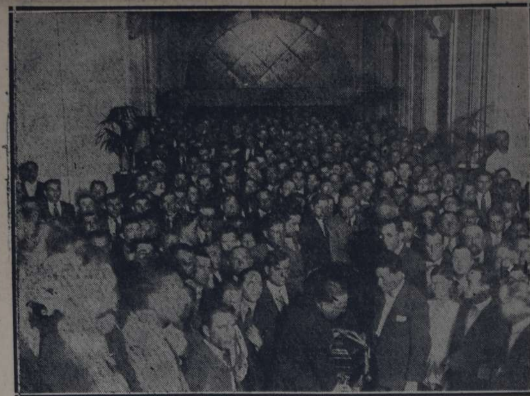
HEGADA DE LOS RESTOS A LA CASA DEL PUEBLO

Por resolución de las agrupaciones respectivas, se han suprimido los actos públicos que se habían organizado para ayer y hoy.