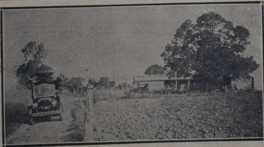
EL CORTEJO FUNEBRE PARTIENDO DE LA CHACRA "LOS CARDALES", PILAR

Alguna vez, historiando nuestro pasado político, el partido novel, hemos recordado los primeros pasos de su iniciación. Hemos recordado igualmente los días primeros de este diario,